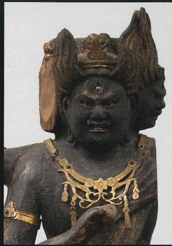
◎大威徳明王像 運慶作 光明院(神奈川) 源実朝ゆかりの最晩年作(建保四年・1216)