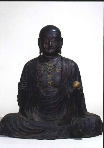
◎地藏菩薩坐像 康慶作 瑞林寺(静岡) 治承元年(1177)東国武士のために造像か