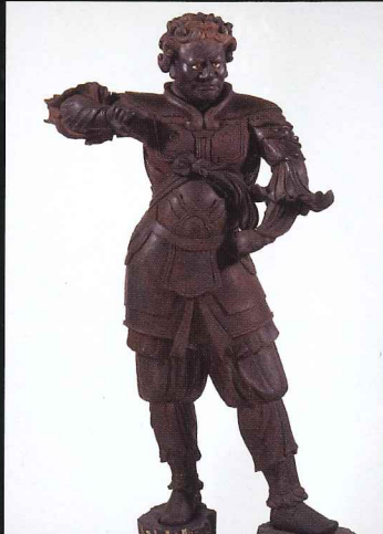
十二神将立像(戌神) 鎌倉国宝館 北条義時を救った運慶作の像の姿を伝える