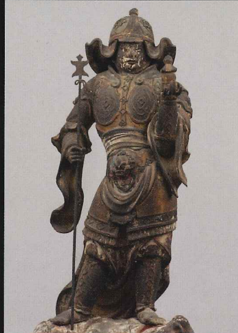
毘沙門天立像 清雲寺(神奈川) 運慶工房作の和田義盛ゆかりの靈験仏