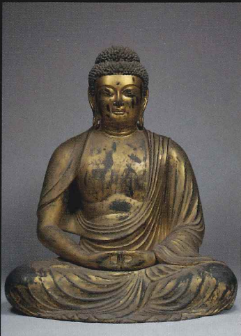
◎阿弥陀如来坐像 宗慶作 保寧寺(埼玉) 建久七年(1196)の三尊と不動明王を一堂に