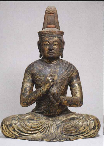
◎大日如来坐像 実慶作 修禪寺(静岡) 承元四年(1210)源頼家供養のため夫人が造立