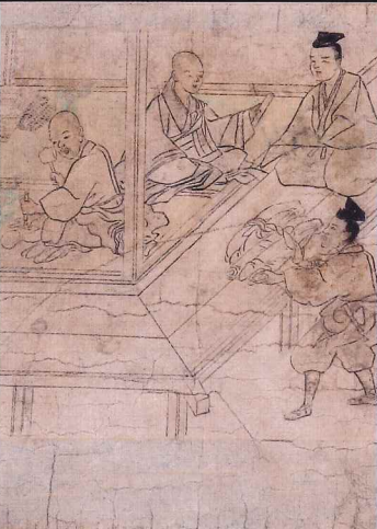
◎類焼阿弥陀縁起絵巻 光触寺(神奈川) 最古の運慶の姿が描かれる絵巻