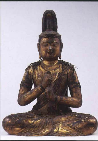
◎大日如来坐像 光得寺(栃木) 足利義兼発願で運慶作の可能性高い