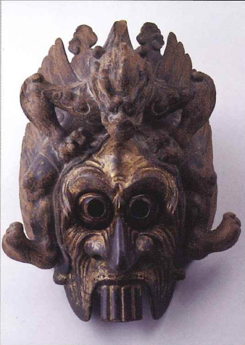
◎陵王面 瀬戸神社(神奈川) 運慶作の四天王像の意匠と共通する