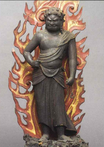
不動明王立像 仏法紹隆寺(長野) 運慶作説がある近年注目の作品