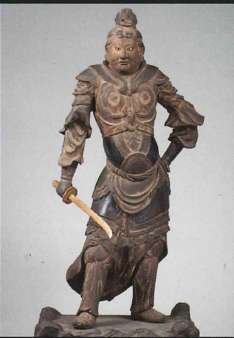
◎十二神将立像(巳神) 曹源寺(神奈川) 運慶・源実朝・三浦氏ゆかりの群像を一堂に