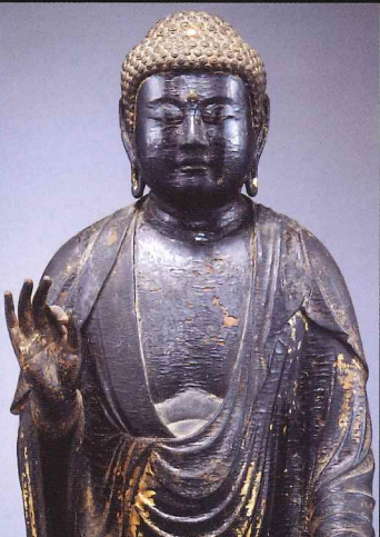
◎阿弥陀如来立像 光触寺(神奈川) 伝運慶作として著名な靈験あらたかな秘仏